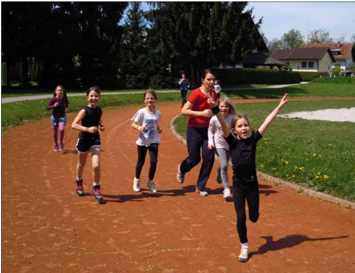
Pridno nabiramo kilometre na Teku podnebne solidarnosti