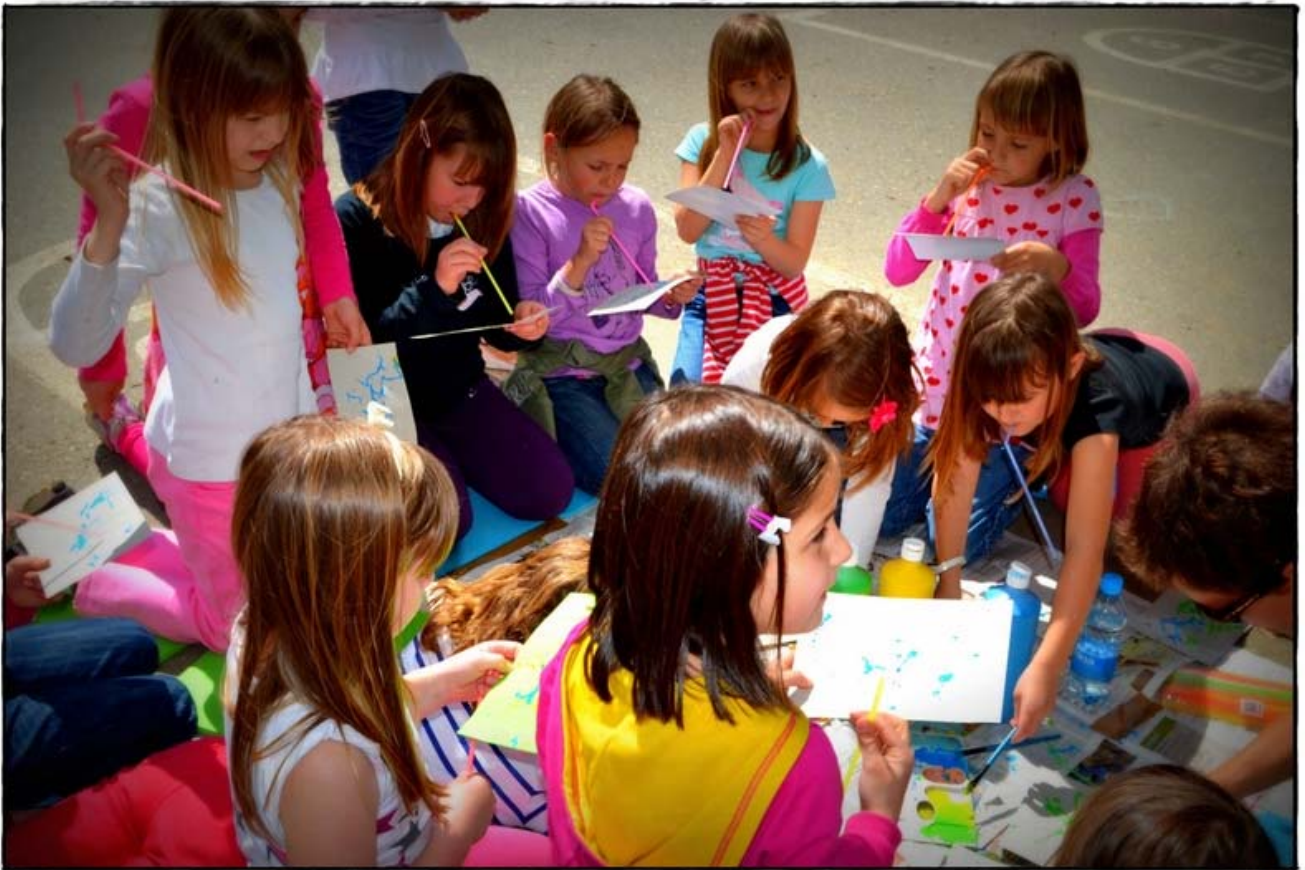
Pihajmo, pihajmo barvne kapljice