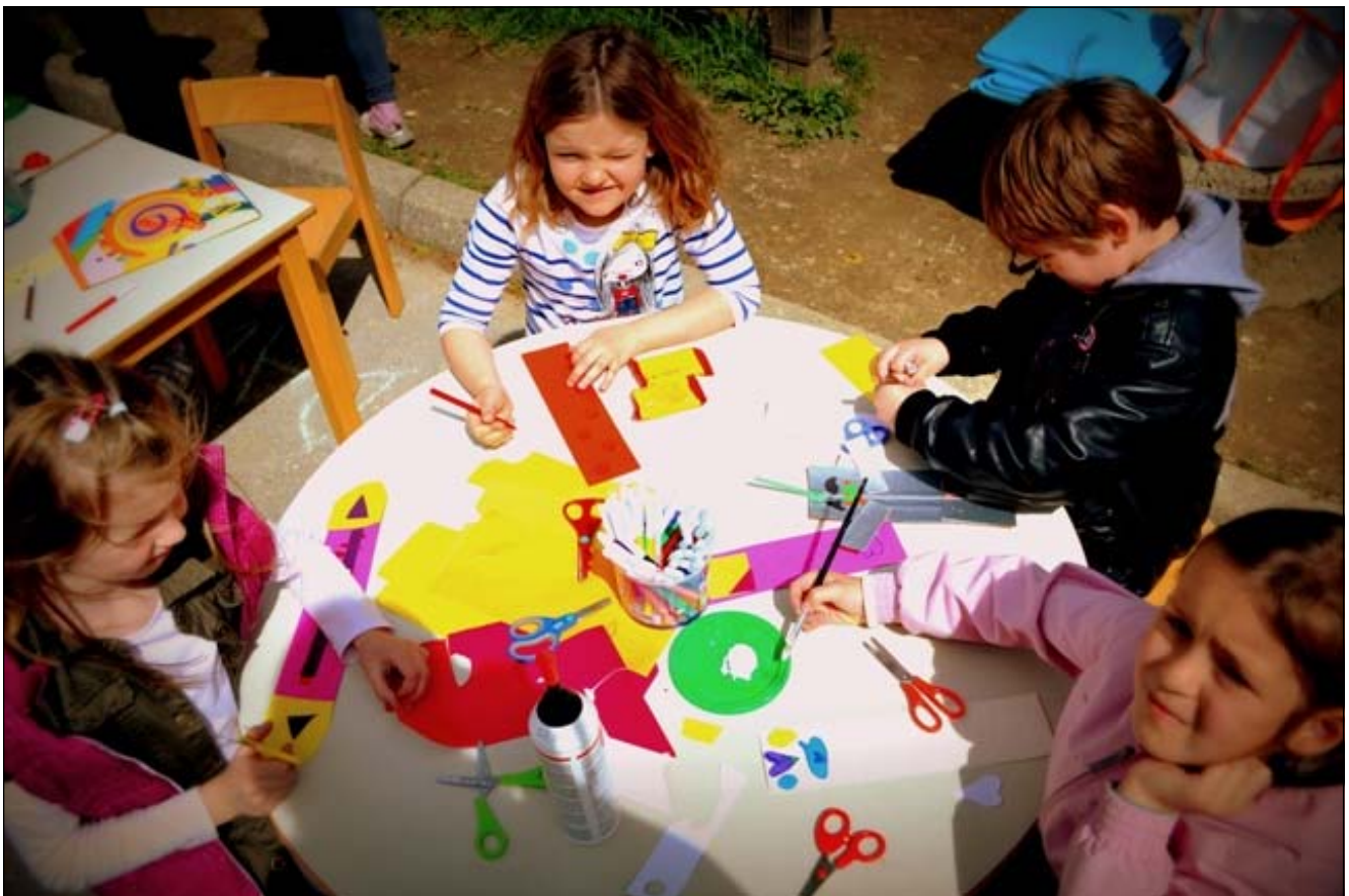
Še knjižno kazalo naredimo, potem pa v bralni kotiček odhitimo.