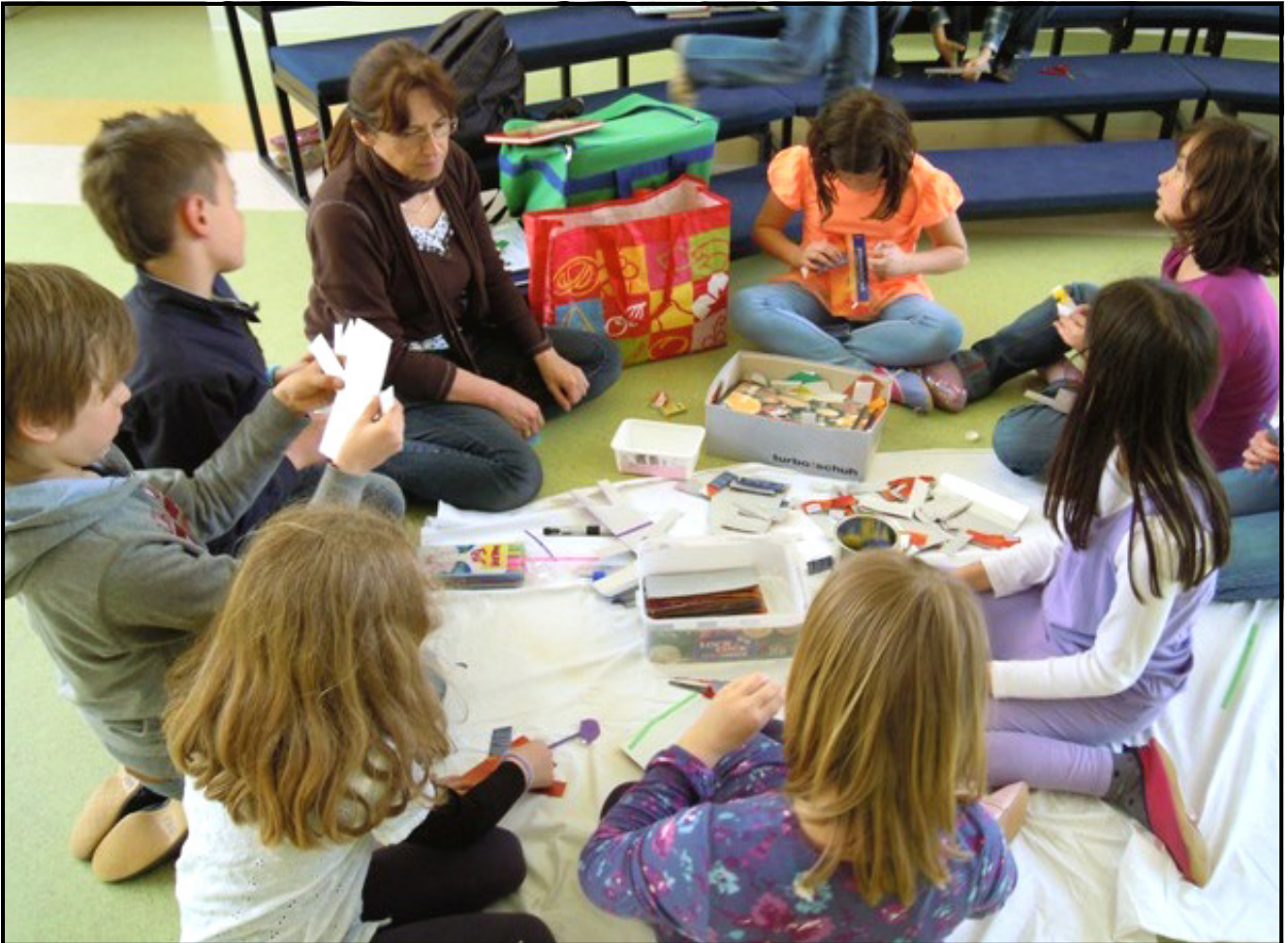
Tu nastajajo robotki iz razrezanih tetrapakov.