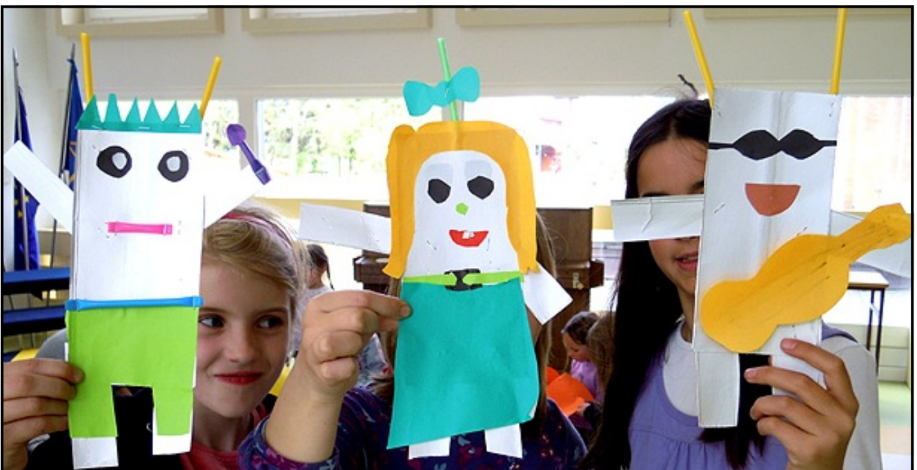
Ti trije bi lahko bili glasbena skupina.