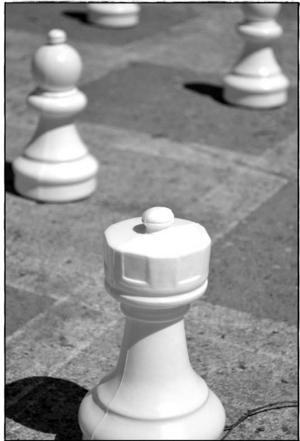
Šah na prostem