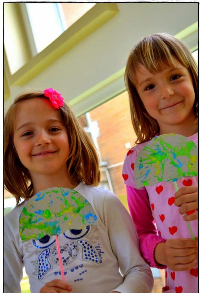
S pisanimi dežniki prvomajskim počitnicam naproti