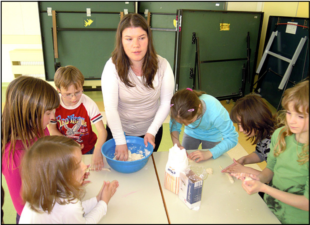
Najprej naredimo slano testo, potem pa iz njega še kaj bo.