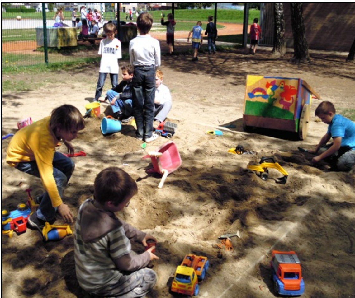
Uživamo v mivki